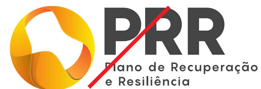
Não alterar cores