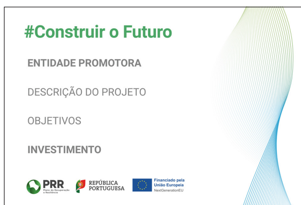
Modelo 2 – Formato 100cm (L) x 150cm (A)

NOTA: Este layout é de maio de 2022. Caso tenha cartazes prévios a esta data, os mesmos apresentam um layout antigo. Dado terem sido produzidos antes da introdução da nova linha gráfica, consideramos que podem continuar a ser usados.