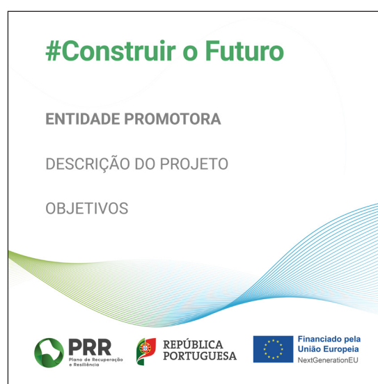
Modelo 3 – Formato 40cm (L) x 40cm (A)

NOTA: Este layout é de maio de 2022. Caso tenha cartazes prévios a esta data, os mesmos apresentam um layout antigo. Dado terem sido produzidos antes da introdução da nova linha gráfica, consideramos que podem continuar a ser usados.