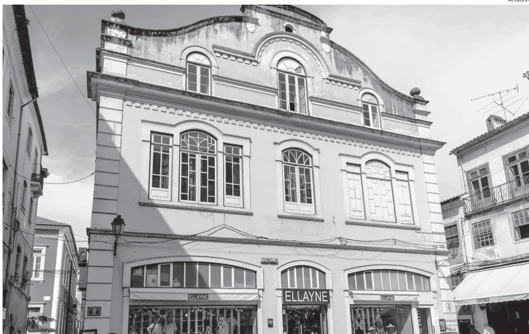
Edifício do Salão Brazil comemora o seu centenário em 2026